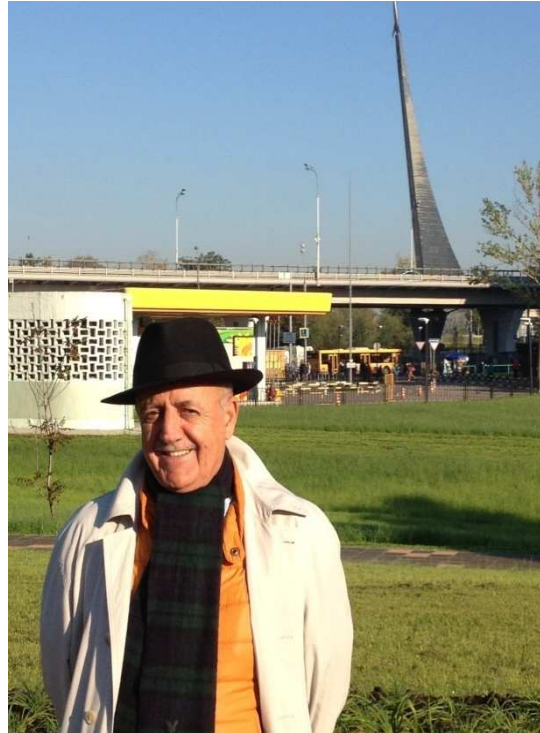
li ber monumenta Kosmosê

Ez îşev hinek melankolîk û xemgîn im. Em li qata hevdehmîn in. Moskow mîna sê xirxalkên zêrîn ên di nav hev da, di tariya şevê da dibiriqe. Dengê trafîka li jêr, mîna xuşîna çeman xwe li jora otêlê dixê. Birca herî bilind a Moskowê li pêş me ye. Zêde napeyîvim. Piranî li her du mêvanên xwe guhdarî dikim. Saetên dawî yên şevê ne. Nîyet nîne em rabin. Em rêwî ne. Divê hinekî bixewin. Tembî û pêşnîyazên dawîyê li hev dikin û ji bo razanê vedikişin odeyên xwe.