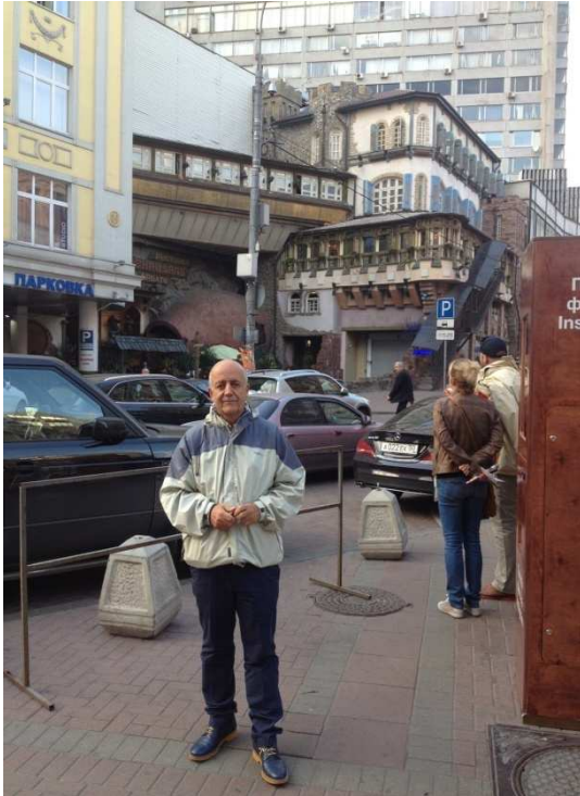
li kolana Arbatê.

Piştê şîv û gerekî xweş em vedigerin otêlê. Ji wan aferînek jî werdigirim ji bo saxlem vegeînê. Îro roja me ya dawîyê ye. Sibeyê êm dê dîsa ji hev veqetin û xwe berdin dûr û kurayîya deryaya xerîbî û hesretan.