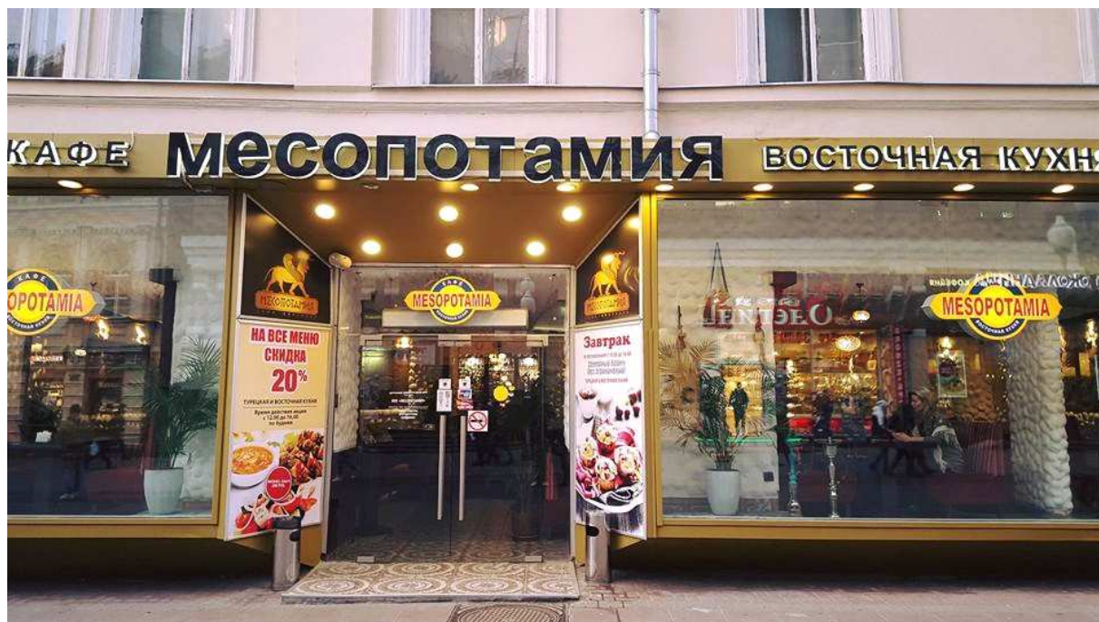
restorant û qehwexaneya Mezopotamyayê li kolana Arbatê.

Kolaneke gelek fireh e û li her du alîyên wê avahîyên saxlem û rengereng xemilandî cî digirin. Wisa jî şano, qehwexane û restorant.