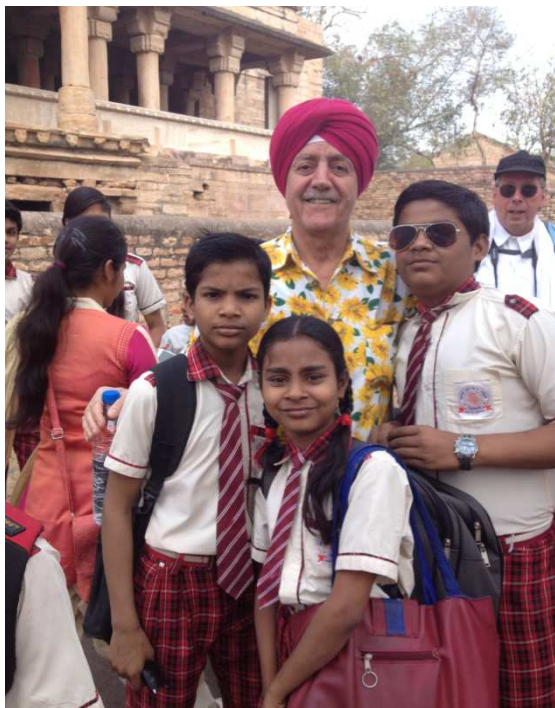
Li bajarê Guawlorê. Nizanim mamostatî, yan sixîtîya min a rojekê hîşt ku ev şagirtên delal bi min ra vê fotoyê bikişînin? Zarokên hindî pir caran yekemîn in di matematîk û sentrecê da.. Ew ê li paş Kalaus e.

Dîtina vî welateparzemînê ji mêj va heyecanê dida min. Berê çend salan min bi wan navên xwe yê kirêt û bi pasaporta penaberîyê, serî li balyozxaneyê Hindistanê dabû. Wan vîze nedabûn min. Ji wê rojê va ev sefer ji min ra bû rik û derdekî. Dunya alem bikare here her welatekî, çima ez nekaribim!?