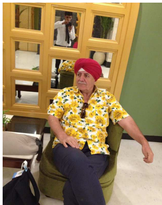
Henek-menek felan, lê sixîtî jî li min hatîye yanê. Kesê nas neke wê bêje e; qey ev guru ye. Yan jî racayê Racaistanê. Li lobîya otêlê, li bajarê Yansîyê..