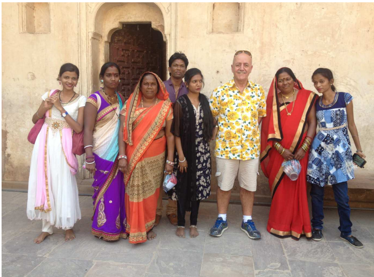
Bi nîv malbatekê ra li hewşîya koşka Raca Mahal, li bajarê Orchayê. Nîv malbat dibêjim, çimkî objektîfa biçûk a kamerayê hemûyan negirt. Malbatê nihêrî ku ez mîna sêwîyan li ber dîwêr rûniştîme, wan ez hîldam nava xwe û me vê fotoyê bi hev ra kişand.

Li gorî mezinayîya wî gol kêr in li Hindistanê. Piranî golên bendavî ne, mîna gola bendava Hîrakud, bendava Gandî ûwd.