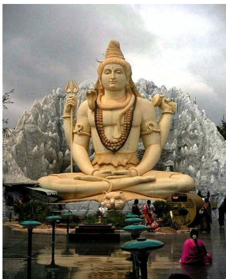
Şivayê sembola huzur û medîtasyonê

India Gate, monument e. Di sala 1921 an da, ji bo bîranîna 90.000 leşkerên hindî ku ji bo berjewendîyên Îngilistanê di yekemîn şerê cîhanê da hatibûn kuştin, hatîye çêkirin. Teqlîta Arc de Triomphe ya Parisê ye. I. Gate 42 m. bilind e. Ji kevirên pûk ên sor di nava baxçeyêke mezin da hatîye çêkirin. Bi hezaran xort û zarokan li her du alîyên rê li ser table û erebeyên biçûk, xwarin û vexwarinên hindî difrotin. Artêşêke kermêş jî li ser wan xwarin û vexwarinan danîbû. Ew xwarin her çiqas bala mirov bikişînin jî ji gemarî û qirêjayîyê meriv nikare bikire û bixwe. Yê Delhîyê dîsa hinek îdare dikirin. Xwarin û vexwarinên bajarên din hîn gemartir bûn. Lê Hindî ne xema wan bûn, dixwarin wan xwarinên seyar. An na mîlyarekî mirov zikê xwe dê çawa têr bike?