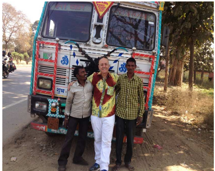
Qamyon û wesayîtên wan jî mîna Hîndîyan rengin in.