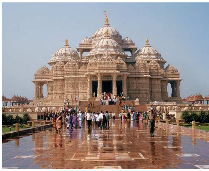
Mezintirîn mabeda ola hinî; Akshardham-Guyartî