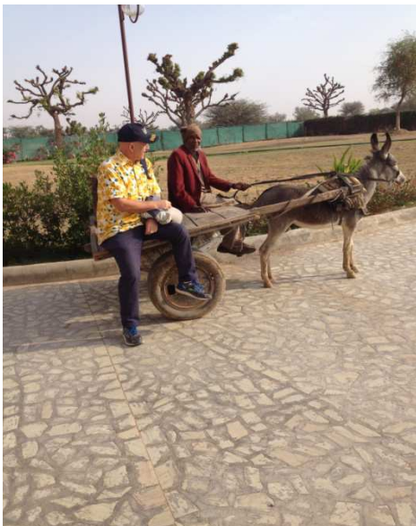
Siwarîya erebeyaya kerê li Mandarwayê

Piştê gereke biwest û xweş, em derengîya êvarê vejerîyan otêlê. Ji ber qirêjîya hewayaya bajêr, piştê her gerê divê meriv hema here serşokê xwe bişo, berê ku tiştêkî din bike. Ji şansê min ra ew şev li otêlê deweteke hindî jî hebû. Min jî îşlikê xwe yê gulgulî mîna yê Hîndîyan li xwe kir û çûm dawetê. Min silavekî hindî da wan û çûm li ber maseyekê rûniştim. Her çiqas rengê min hinek gewrik bûbe jî, zêde ne xerîb bûm ji wan ra. Gelek qedrê min girtin. Salon adeta deryaya rengan bû. Nemaze cilên xaniman ku awa bi awa dibiriqîyan û ewqas jî li wan hatibû. Hela muzîka hindî, ez mest kirim.