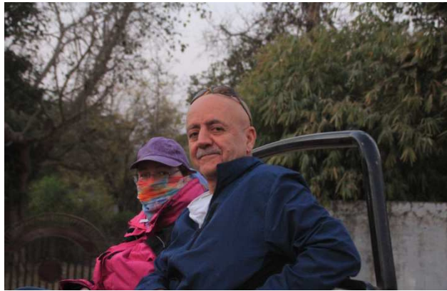
04 ê beyaniyê li parka Pannayê. Êh! Jiyan e, ev. Meriv geh li cîpê siwar dibe, geh li firokeya duqat û geh jî li erebeyaya kerê, tabî..

Bi heyecana dîtina wan pilingan em li cîpan siwar bûn û me berê xwe da parka Panna. 45 deqe şûnda em gihîştin parkê. Navê wê park e, lê biqasê welatekî Balkanan mezin e. Enwayê çeşîd dar, dirinde û firinde tê da bi azadî dijîn. Biqasê du saet em li nav parkê bi cîpan gerîyan. Li ser rêyan 10-15 cîpên din jî gurubên din anîbûn.