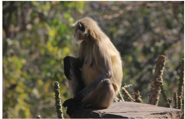
Hanûman efendî qet tenezûl nekîr li me binihêre.. Li parka Pannayê em rastê Pilingî nehatin. Lê têra xwe meymûn hebûn

Dema pêşna pilingan bihata, ji bo xwe jê biparêzin, dibû gareqara meymûn û firindeyên li serê daran. Tam di wê demê da ranceran(rêberan) digotin; "bêdeng bin piling tên!" Bi heyecaneke mezin me tenê ne dengê xwe, "bîhna" xwe jî dibirî, ku piling sil nebin, ji kerema xwe derkevin û em wan bibînin.