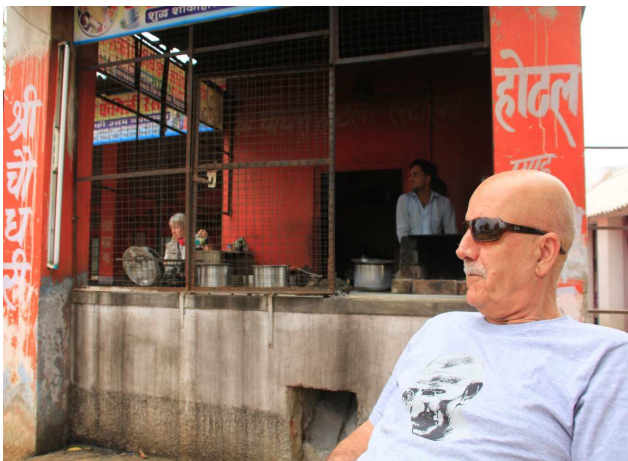
Bêhnvedanek li "loqanteyekê li ser rêya Orchayê

Piştê du saet rê, me xwe gîhand bajarokê Orchayê. Ev bajarok 17 kîlômêtro nêzikê bajarê Yansîyê ye. Bi 12 000 nişteciyên xwe va yek ji bajarê herî aram ê Hindistanê ye. Di nava wan bajarên Hindistanê da dema meriv rastê bajareke wiha biçûk û aram tê ecêbmayî dimîne.