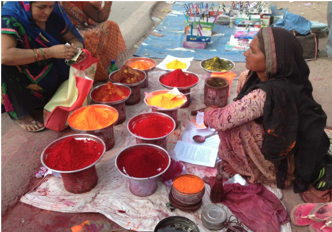
bazara boyaxê, Boyaxfiroş li ser qolaneqê bajarê Yansîyê boyaxên xwe difiroşe. Xanim rengîn e, bazar rengîn e..

Otobos car din li ser kort û çalikên rê hilpekîya, daket û hemû organên me yê hundurîn jî tev li hev ket. Ne pişt ma, ne tenişt û me xwe gîhand Yansîyê.