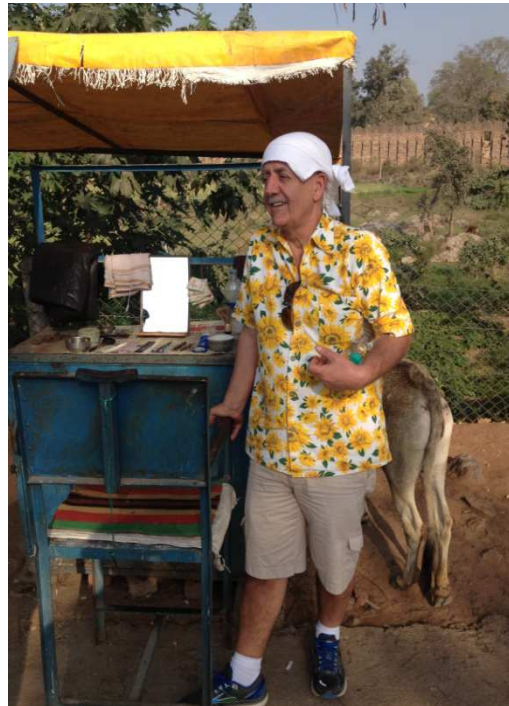
Serê keçel ne hewceyê traşê ye! berberxane li bajarê Orchayê.

Îro jî çîlekêşên vî olê wek sadû tên binavkirin. Buda bi mirovan ra êş û çîle kişandîye. Wî xwe ji „pêxemberekî“ ji „nûnerê xwedê“ bêhtir, wek mamostayekî bi nav dikir. Ji ber vê jî ne tirs û hova xwedê, berevacî hez û zanîne xwestîye li jîyana mirovan belav bike.