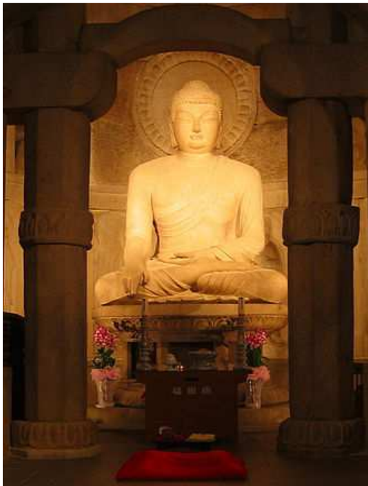
yeK ji hezaran peykerên bûdayî. Li Ewropayê jî gelek peyker û mînyaturên wî hene bi taybetî ji di salonên yoga û sporê da.

Tê texmînkirin, ku Siddhartra Gautama berîya Îsa di navbera salên 563 û 483 an da jîyaye. Siddhartra prens e û kurê qeralekî Hindî ye. Ji bo dawî li êş û elemên jîyanê bîne, di xortaniya xwe da dev ji racatîyê berdaye. Herçiqaş bavê wî xwestîye kurê xwe li şûna xwe qeral teyîn bike jî, wî guh nedaye bavê xwe û rêya çîle û êşkişandinê hilibijartîye. Wî terka jîyana dewlemend a koşk û serayê kirîye û xwe berdaye nava deryaya mirovan. Wek Sadû (mirovê pîroz) rê nîşanê feqîr û belengazan daye.