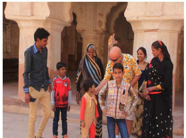
Li kelaya Rac Mahalê, li bajarê Orchayê. Ev nêvekî ji malbatekê Hindî ye. Nêvê din jî li aliyê din a hewştîya kelayê rawestîya ye.

Kesê ji aramîyê hez dike, li Hindistanê, divê li Orchayê bi cî be. Yan jî li gundên hêşînayî yê biçûk. Ev bajar, lê kêleka çemê Betwa ava bûye. Bi koşkên xwe yê Raca Mahal û yê racayên Orchayê navdar e. Çend mabedên biçûk ên hindî jî li vî bajarokê hene.