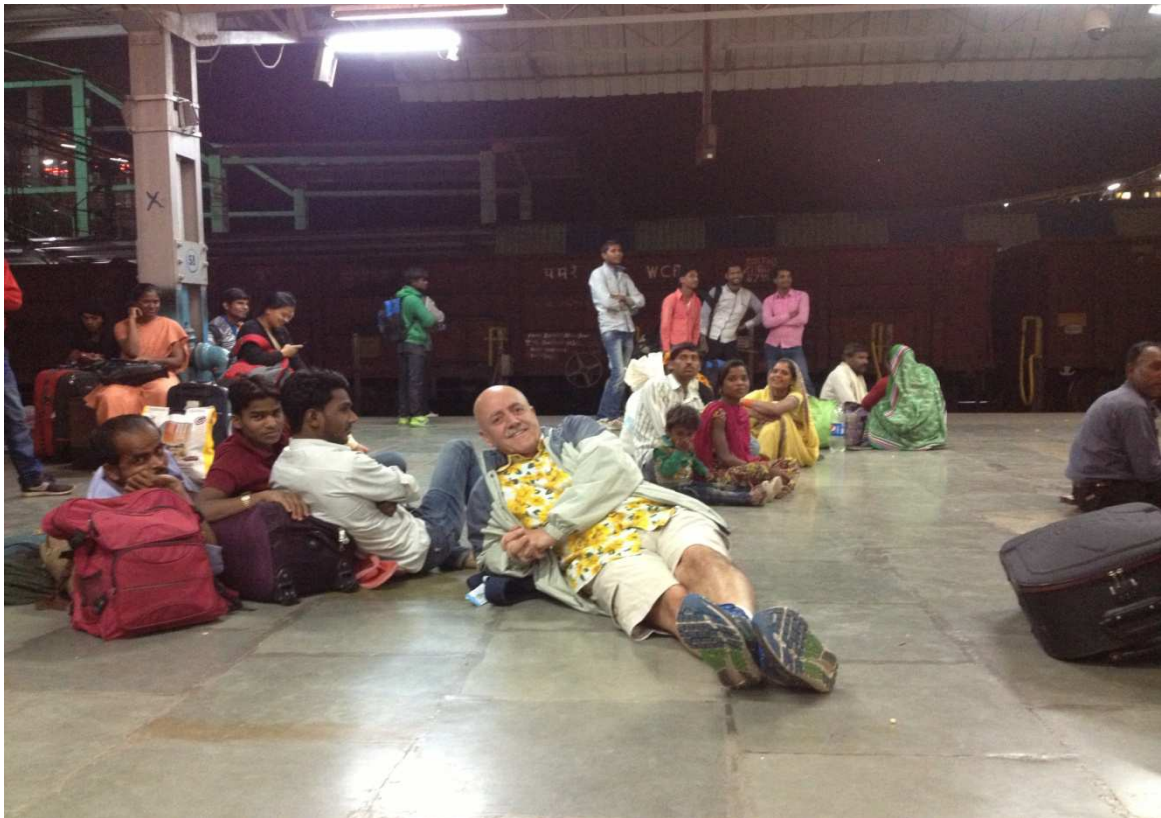
Li stasyona trenê Railway ya Yansiyê. Dirêjkirinê min xwe dirêj kir, lê ne li ser banê trenê...

Ev bajar herhal ji ber ku ewqas rastê dagirkeriyê hatiye, li dijê dagirkeriya Brîtanayê yekem serhildan jî ji vî bajarî dest pê kirîye di sala 1857 an da, di pêşengiya Ranîyê Yansiyî da.