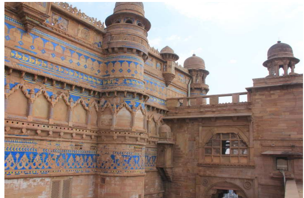
Kelaya Gwaliorê, dîwarên derva bi çîntîyên şîn hatine xemilandin. Yê hundurîn jî qisimen bi çîntîyên sor û porteqalî xemilîne. Hemû desenên wê simetrik in.