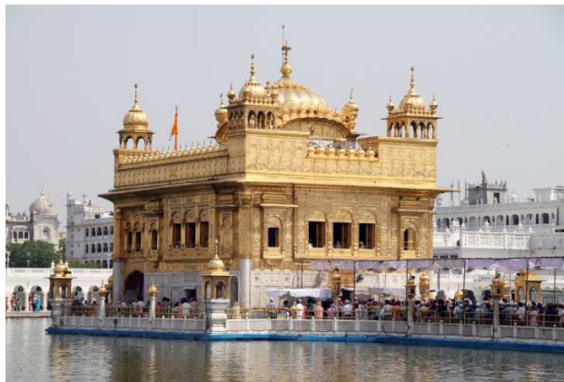
Mabeda zêrîn a sixî. Mezintirîn mabeda sixî ye li Hindistanê. Bi mîmarîya hindî çargoşe hatîye avakirin li bajarê Amrîstarê. Hindî jê ra Harmandir Sahib û Harî Mandir dibêjin.

Ola sixî piştê Îsa di sedsala 15 an da li bakûrê Hindistanê ji aliyê Guru Nana Dev hatîye damezirandin. Îro li hemû cîhanê 28 mîlyon bawermendê xwe hene. Ji sedî 95 hindî ne. Bi tekane xwedayîyê bawer dikin. Guru bi wateya „mamosta“, six jî bi wateya „şagirt“ e. Navê sembola wê Khanda ye. Mabeda wan a mezin a zêrîn li bajarê Amrîstarê ye.