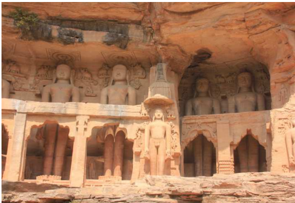
Peykerên Yaîn-Tîrthanqaras li bajarê Gwaliorê. Ev peyker di zinarê da hatine tiraştin û dişibin ên firewinên Misirî

Piştê saet û niv rê, me xwe gîhand bajarê Gwaliorê. Nişteciyên Gwaliorê mîlyon û sed hezar in, bi tevê gelek mabed û kelayên xwe va Gwalior paytexta herêma Madîhya Paradesê ye. Dema trêna me li stasyonê rawestîya, ji ber ku em pir westî bûn, me yekser berê xwe da otêlê. Odeyên me gelek fireh û hewadar bûn. Klîma baş dixebitîn. Heta sibe min xewa xwe baş kir. Sibe piştê taştêyeke dewlemend a hindî, me berê xwe da gera nava bajêr. Şofêr û mûawênê wî dîsa bi me ra bûn. Em dê gera xwe ya mayî, bi otobosê tamam bikin. Gwalior ji Delhîyê 340 û ji Agrayê 120 kîlomêtro dûr e. Bajar ji sala 1021 dema Mehmûdê Gazneyî heta sala 1725 an di bin dagirkerîya îslamê da maye. Paşê dagirkerîya Îngilistanê dest pê kirîye, heta sala 1948 an serxwebûna Hindistanê. Piştê serxwebûnê jî, bûye paytexta Madîhya Pradesê. Mîna Yansîyê li vir jî her cûre ziman, ol û mabed hene. Ji sedî 95 hindî ne. Ên din jî ji olên din in.