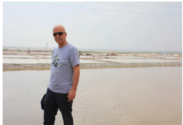
Kara xwê, li nêzikê Agrayê. Ji van kanîyan gelek xwê tên hilbirîn. Têra hemû Racaistanê dike, heta dişînin derên dîn jî.

Derengîya êvarê hewa ku piçek hênik bû, em çûn serdana kelaya sor. Ew di sala 1565 an da di dema sultanê Moxul Akbarî da hatîye çêkirin. Agra di heman demê da, ji sala 1526 heta 1701 an payteta Moxulên musulman bûye. Hukumdarên bi navên, Babûr, Humayûn, Akbar, Cîhangîr, Şah Yahan û Ayuran Gezeb li pey hev bûne sultanên vî paytextê. Akbar kevirên sor ji Racaistanê daye anîn û vê kelayê ji bo xofîya hukumê xwe nîşan bide ava kirîye. Dîwana sultan, haremên carîyeyan, qîşleyên leşkeran, li jorê bircên zerevanan, li jêrê zîndanên dîlan, gelek beş û avahî di vê kelayê da cî digirin.