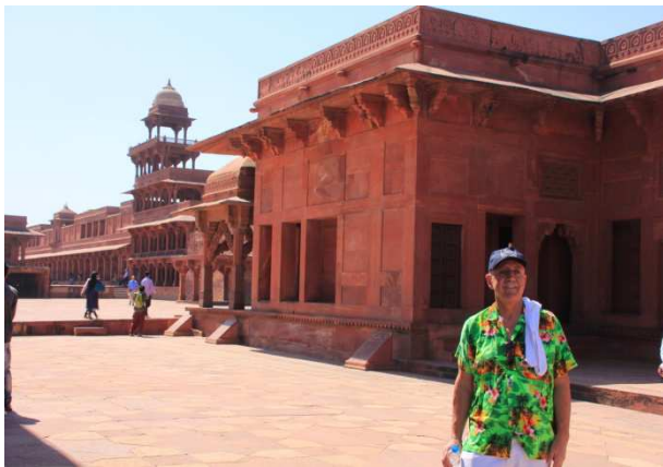
Kelaya bermayîyê Mogulan li bajarokê Fetahpur Sikrîyê, 37 km. nêzikê Agrayê ye. Ji Quncikên wê yê izbe hîn ji Bihna zulm û xwînşwarîyê tê.

Piştê ku me li otêlê hinekî bêhn veda, Em derketin gera nava bajêr. Bi mizgeft, kela û serayên xwe va şopên dagirkerîya îslamê, bi her awayî dixuyên li vî bajarî. Olên hindî bi hemû terîqet û mabedên xwe va îro ola herî berfireh a vî bajarî ne.