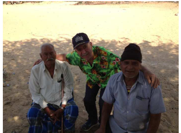
qal - qaltir - qaltirîn li bajarokê Ajmerê Sîya darê dizane, ka kî wê li kûderê lîngan cot bike?