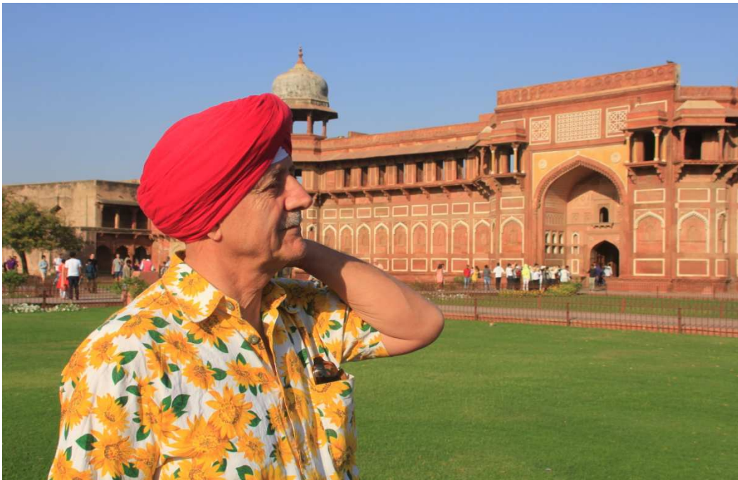
Li ber qelaya Akşarê moxulî, ku ev êdî ne cîyê zulmê ye. Muzeya pere qezenckîrîne ye ji bo şaredarîya Agrayê.

Piştê gerê ez li ser pêlikên derîyê paşê Tac Mahalê rûniştim û min qasekî li çemê Yumnayê temaşe kir. Tav li ser pêlên wî yê aram diteyisî û çemî bi rengekî zivîn boyax dikir. Yumnayê ez bi xwe ra herikandim, birim heta pirsê destpêkê. Herikîm û çûm, heta rêberê me bang kir: „Haydê rabin em ê herin, dema tamam!“