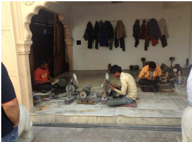
Atolyeya kevirên yaqût û yadeyê. Karêr ji van keviran peykerokên fîl, pîlîng yan jî Budayî çêdîkîn. Gustîlk, morî û mircanên turîstîk çêdîkîn. Xwedîyê atolyeyê jî wan difiroşe. Karêr rojane herî zêde 2-3 ewro, xwedî (sahîp) jî herî kêm 1000 euro qezenc dîkîn. Çerxa te bişikê felek!