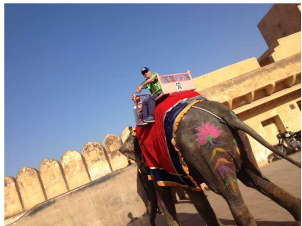
Dawîya siwarîyê ye...

Fîl aheste aheste diçe ber bi pîlatforma ku ez ê lê peya bim..