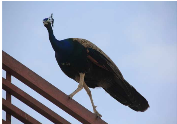
Hîna beyanî ye. Teyrê tarwis per û baskên xwe venekîrîye

Bi vê temaşaya xweşik a li çolê, me xwe gîhand bajarê Mandawayê .