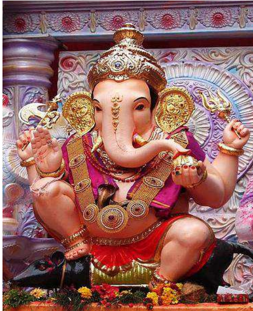
Yek ji encamên fantazîyên mirov; Ganêşa, sembola hêz û berekêrî

Bi navê Ganêşa gelek stran û dua hene û her wisa gelek versiyonên wê jî. Gelek mabed li ser navê Ganêşayî hatine avakirin. Bi saya vê bawerîyê mirovên hindî hez ji fîlên xwe dikin. Fîlên xwe rengareng dixemilînin. Bi xêra wan pere jî qezenc dikin. Her sal mêhrîcana Ganêşayê çêdibe li Hindistanê. Hetta li Parîsê jî.