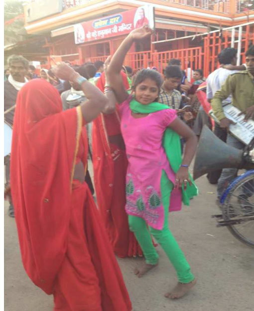
Keça delal pêşî ji bo xwe, paşê ji bo Ganêşayî dîreqise.