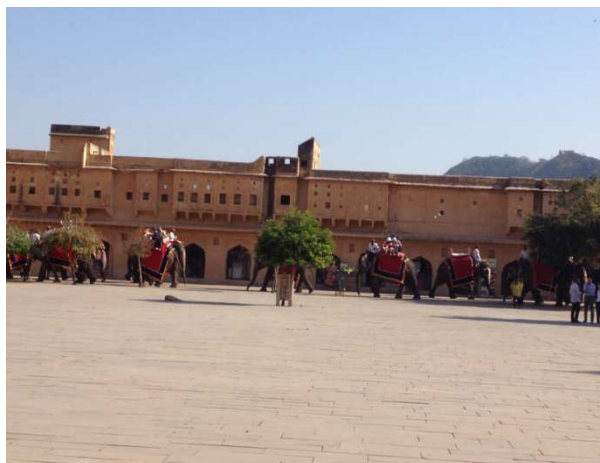
Çarwanê me yê filan li kelaya nêzîkê Yaipurê.

Min ji germayî zûtirîn dem xwe avêt binê sîya dara li nivê holê û rûniştim. Hiş û awirên min çûn ser filên qirase û narîn ku dîsa li pey hev hêdî hêdî vedigerîyan jêrê, daku qefleyeke nû bînin jorê. Li gorî gotina ajovan ev çûn û hatin rojê 20-30 car dubare dibûn. Fîlên reben, de were serî hilnede!