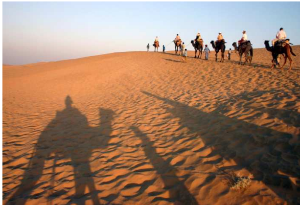
Çola Thar - Xwezaya çolan e. Karwanek diçe û yek tê.

Tahar 273.000 km 2 . ye. Çola herî mezin a Hindistanê ye, li herêma Racastanê. Rojavayê wê Pakistan e. Çemê Hîndus li rojhilatê wê ye. Rengê wê ne mîna yê Saharayê sor e. Tahar zereke vekirî û hin cîyên wê jî gewr in. Vahayên tê da pirtir in ji Saharayê. Tûmên daran dixuyên li nêzîkê gund û bajarokên li derûdora Taharê. Li vê çolê jî dîrok û serûweneke karwanîyê heye, mîna Sahara û Gobîyê. Bagera ku ji çolê radibe carinan xwe digihîne paytext Delhîyê jî. Hewa jixwe qirêj e li wir, bager jî wisa dike ku meriv nikare nefes hilde û dibe sedema mirina mirovan. Li hin deverên çolê girên kevîran jî hene. Hin ji vana kevîrên xwêyê ne.