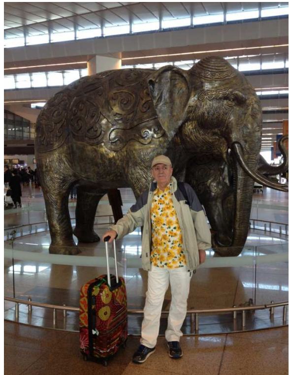
Saeta dawîyê li balafirxaneya Indra Gandî ya Delhîyê